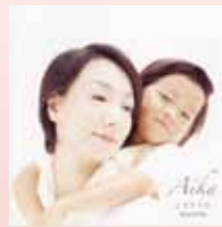
『こもりうた 魔法の時間』

愛する貴方と、いとしの子供達へ、女性とし母として今の気持ちを大切に残したく、言葉を紡いでゆきました。