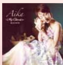
『My Classics 魔法の時間』

般若心経を十のブロックに分けてメロディを付けるという天啓を受け、聖歌「般若心経」が完成に至りました。