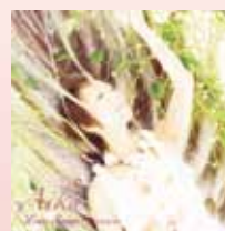
『Love songs 魔法の時間』

緑の深い森・どこまでも広がる青い空・一筋の光・大地に芽吹く花・風の歌声・・・体で感じる感覚を辿るように、言葉を感じてゆきます。